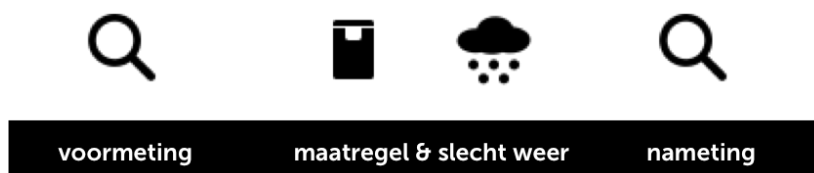
Figuur 2. Een visuele weergave van de weersinvloed tijdens de voor- en nameting. Na de voormeting zijn de maatregel en het slechte weer tegelijkertijd van invloed op vervuilgedrag. Tijdens de nameting kan je dan niet bepalen of het weer of de maatregel voor een vermindering van het vervuilgedrag zorgt.

Nu is dit een vrij duidelijk observeerbare verandering in de omgeving. Maar het kan veel subtieler. Wanneer bijvoorbeeld het weer slechter wordt, kan het zijn dat tijdens de nameting minder mensen door de winkelstraten lopen. Dit zorgt ervoor dat je op de nameting minder mensen ziet vervuilen. Het lijkt dan, ten onrechte, alsof het vervuilgedrag verminderd wordt door de felgekleurde vuilnisbakken (zie figuur 2).