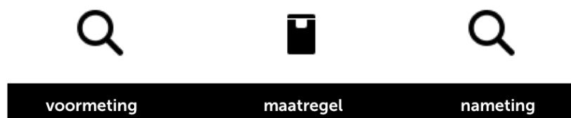
Figuur 1. Visuele weergave van een voormeting en nameting.

Om te zien in welke mate het gedrag is veranderd door de maatregel wordt de meting na het plaatsen van de maatregel (nameting) vaak vergeleken met een voormeting (zie figuur 1).