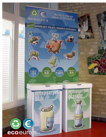
Ecoeuro's op een basisschool

“Als verenigingen, clubs en maatschappelijke organisaties actief bijdragen aan de inzameling, zal in overleg met de gemeente, zo goed mogelijk worden gefaciliteerd dat een deel van de opbrengsten van diverse afvalstromen naar hen terugvloeien”. Aanbieders van bedrijfsafval kunnen met hun inzamelaar in overleg over wat dit betekent voor hun verwerkingscontract