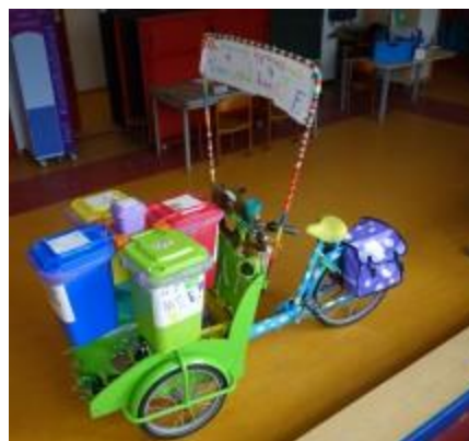
De Zwaluw Afval Fiets in Amstelveen

Bij een wedstrijd voor kinderen is het van belang om rekening te houden met de leeftijd van de kinderen en de wensen van de ouders. Kinderen zijn, naar gelang van de situatie, gevoelig voor beloningen. Moet een kind eigenlijk op school zitten? Dan is een wedstrijd op zich al belonend genoeg. Kan het kind thuis achter zijn spelcomputer zitten? Dan is er meer nodig om hem aan het "prikken" te krijgen. Ook over de beloning aan sich moet je goed nadenken. Kinderen tot een jaar of 12 zullen eerder geneigd zijn mee te doen als er 10 keer 25 euro wordt verloot. Dat is voor hen een aanzienlijk bedrag. Als ze eenmaal in de brugklas zitten en aan hun eerste krantenwijk beginnen, is 25 euro plotseling niet meer zo veel. In dat geval is het beter om 1 keer 250 euro te verloten. Het is ook mogelijk, en wellicht de beste optie, om beide mogelijkheden te hanteren. Hanteer zowel een kleine kans op een grote prijs, als een grote kans op een kleine prijs.