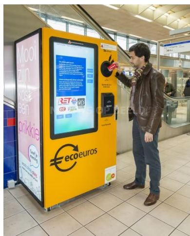
Ecoeuro's op een station

Het gemak om het inleversysteem te bereiken is van zeer groot belang. Drukke, maar goed bereikbare locaties zijn een voorwaarde. Ook locaties waar mensen al een goed gevoel hebben zoals scholen of sportverenigingen of locaties waar in de huidige situatie al afval wordt verzameld zijn geschikt. Bijvoorbeeld milieuparkjes of bij een sportvereniging waar al afval, bijvoorbeeld papier, wordt ingezameld.