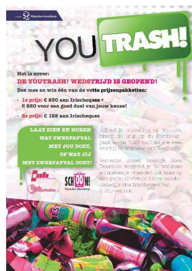
Youtrash flyer

Ambtenaren kunnen een wedstrijd bedenken en organiseren op basis van de specifieke zwerfafvalproblematiek in een gemeente. In dat geval is het aan te raden te zoeken naar externe partijen die een belang hebben bij een schone omgeving en die de actie willen promoten of sponsoren. Denk hierbij aan ondernemers, sportverenigingen, beheerders van en exploitanten in recreatiegebieden. Ook kunnen bestaande netwerken van jongeren of volwassenen worden ingezet in de communicatie.