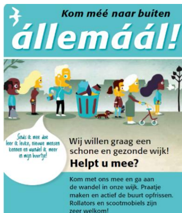
Flyer Troeptrimmen

waarbij senioren gingen wandelen en ondertussen, door middel van een sportbeweging, zwerfafval opruimen. Het sociale en fysieke aspect van het opruimen zijn goede redenen voor deze doelgroep om mee te doen.