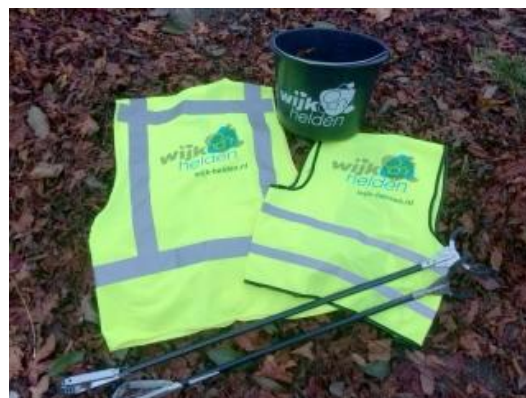
Hesjes en prikkers

Ook hebben de deelnemende jongeren soms een positieve invloed op hun vrienden doordat ze elkaar gaan corrigeren om geen zwerfafval te veroorzaken. Ze hebben namelijk geen zin om later de 'rotzooi van hun vrienden' op te ruimen. Er zijn echter ook aanwijzingen dat jongeren stoppen