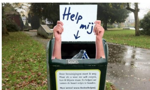
Help Mij! borden in Rheden

Het is van belang om vooraf en tijdens de uitvoering van de actie goed met de doelgroep te communiceren via websites, de krant, social media, de lokale omroep en/of direct contact. Een ludieke actie kan op een goedkope manier veel aandacht creëren voor het onderwerp. Zo waren de 'Help Mij!' borden die uit de afvalbakken in Rheden staken een doorslaand succes, met vele aanmeldingen van potentiële adoptanten tot gevolg.