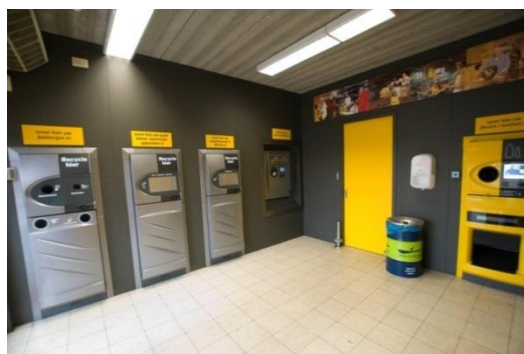
Supermarkt in Eerbeek

Bij het inleveren van afval ontvangen de mensen of de organiserende organisatie, zoals bijvoorbeeld een sportvereniging, direct een beloning. De hoogte en wijze van belonen verschilt. In de praktijk wordt dit systeem nog slechts op kleine schaal toegepast. De verwachting is dat dit systeem geoptimaliseerd kan worden als het op een groter schaalniveau wordt ingevoerd. Het voordeel is dat het inleveren van afval dan ook steeds meer de norm zal worden.