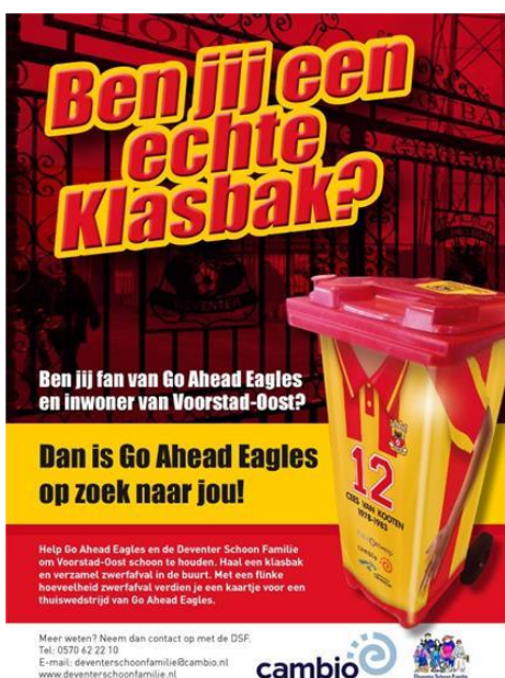
Poster Klasbakkenactie