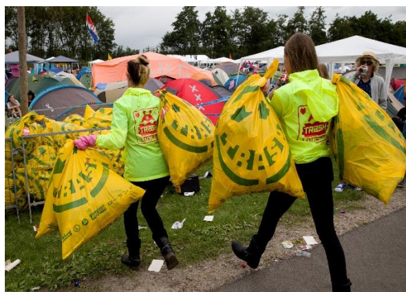
Trash Lottery op Lowlands

Een loterij is een ludieke manier om het zwerfafvalprobleem aan te pakken. De Trash Lottery op Lowlands, georganiseerd door Nederland Schoon, is een voorbeeld van een manier waarop je zwerfafval op evenementen tegen kunt gaan. Een volle Lowlands vuilniszak fungeert als lot en na inlevering maakt een notaris bekend wie de winnaar is. De loterij is eenmalig, kost relatief weinig geld, speelt in op de actualiteit door middel van de prijs (bijvoorbeeld speciale plaatsen bij een concert), kost de deelnemers weinig tijd en geeft de organisatie de gelegenheid om zwerfafvalproblematiek onder de aandacht brengen.