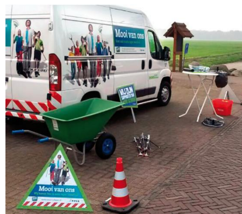
Bus opschoonacties Mooi Schoon

Een buurt, school of vereniging kan ook het initiatief nemen voor een eenmalige actie, waarbij de gemeente faciliteert door materiaal beschikbaar te stellen en de actie breder te verspreiden binnen de gemeente. De gemeente of een andere organisatie kan zijn waardering uiten door middel van een versnapering, een feestje of een financiële of materiele beloning.