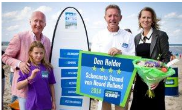
De Schoonste Strand Verkiezing 2014

geworden en scoren een zeer hoge gemiddelde schoonheid (een 9,5). De wedstrijd heeft veel aandacht gegenereerd en mensen gemobiliseerd. Een belangrijke succesfactor van de Schoonste Strand Verkiezing is het feit dat de metingen door een onafhankelijke instantie worden uitgevoerd. Daarnaast brengt de verkiezing stakeholders samen zoals gemeenten, paviljoenhouders, Stichting de Noordzee, leveranciers van slimme middelen en de sigarettenindustrie. Hoewel één strand tot winnaar wordt uitgeroepen, kunnen meerdere stranden vier sterren behalen en deze score