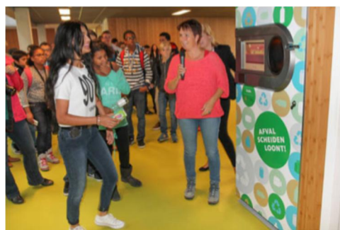
Greenup op een middelbare school

Een andere methode is het direct uitkeren van het tegoed via een bonnensysteem. Deze bonnen kunnen dan direct, bijvoorbeeld bij een supermarkt, een kantine of een koffiezaak, worden ingeleverd. De directe beloning moet dan wel voldoende groot zijn, een zeer kleine vergoeding is minder interessant. Deze methode is daarom niet geschikt voor inlevering van verpakkingen per stuk, maar is wel toepasbaar voor inlevering van zakken of per kilogram