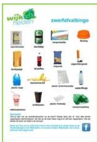
Zwerfafval Bingo

Zakgeldprojecten geven de deelnemers beperkte autonomie . Iedereen moet namelijk op gezette tijden de ronde lopen en kan niet zelf bepalen wanneer hij deze ronde wil lopen. In de manier van uitvoering kunnen de jongeren wel invloed hebben. Uit de praktijk blijkt dat jongeren bij het verzamelen van het zwerfafval behoefte hebben om de werkzaamheden op hun eigen manier uit te voeren. Het is daarbij aan te raden om de jongeren te betrekken bij de manier waarop wordt gewerkt. Zo waarderen de jongeren het erg wanneer ze het opruimen op een leuke manier mogen uitvoeren. Bijvoorbeeld door zwerfafval in elkaars zakken te gooien. Ook vinden de jongeren het prettig wanneer ze hun eigen slimme aanpak kunnen delen met anderen en wanneer ze meezoeken naar locaties waar het meeste valt op te ruimen.