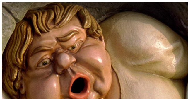
Holle Bolle Gijs in de Efteling

Een afvalbak die iets toevoegt aan het traditionele concept, doorbreekt het automatische gedrag van mensen. De bak verrast, vraagt aandacht en maakt anders onzichtbaar gedrag zichtbaar. De bekendste pratende afvalbak is Holle Bolle Gijs in de Efteling. Holle Bolle Gijs verleidt kinderen en hun ouders tijdens hun dagje uit om hun afval in de bak te gooien, met een 'dank u wel' als beloning.