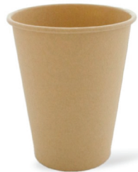
Karton + PLA of PBS