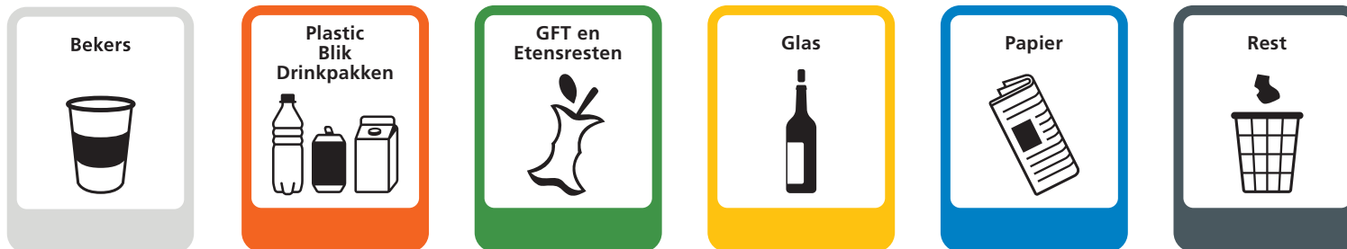
Pictogram 'bekers' naast de pictogrammen voor de hoofdstromen.